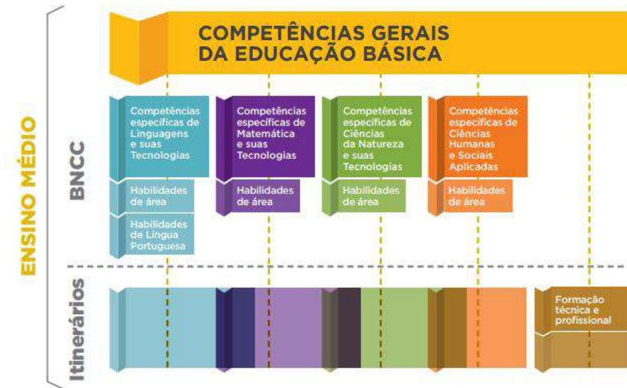
Figura 2. Competências Gerais da Educação Básica